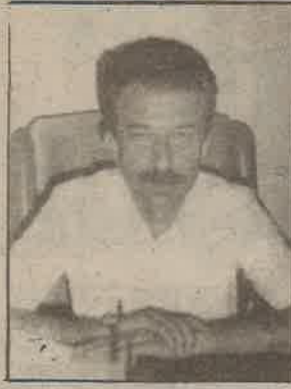
Mimarlar Odası Başkanı Ali Seven