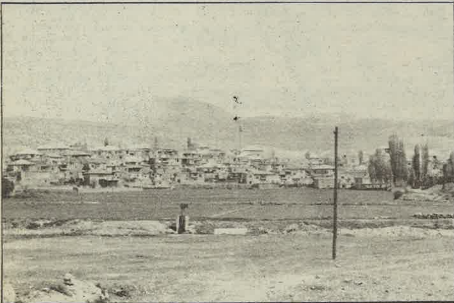
Muhammed Kudsi Hazretleri'nin bulunduğu Çavuş Nahiyesi