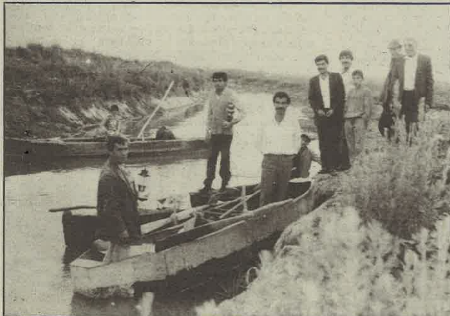
Çarşamba Çayı yakınında bir kanalda balık tutan ve! "Suğla Gölü'nü biz de arıyoruz" diyen Gökhüyük köylüleri.